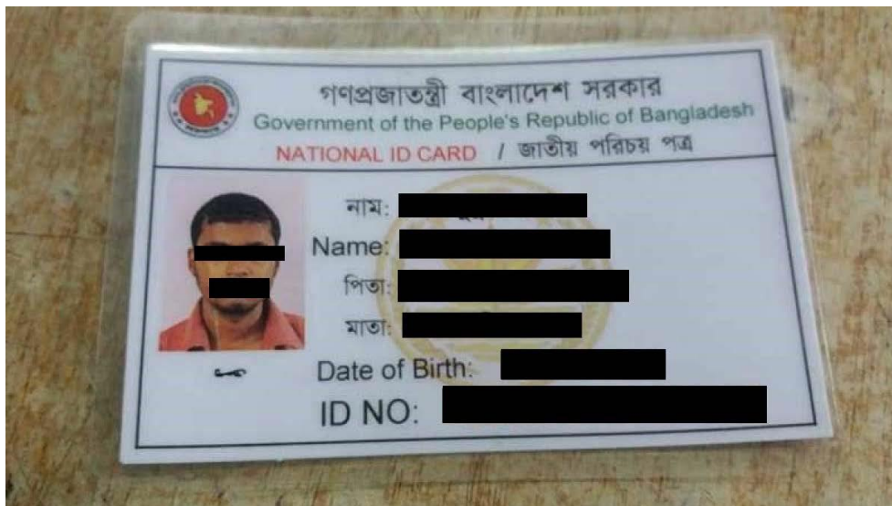
Exempel på äldre variant av NID (framsidan) med 17-siffrigt id-nummer (inleds med födelseåret). 71