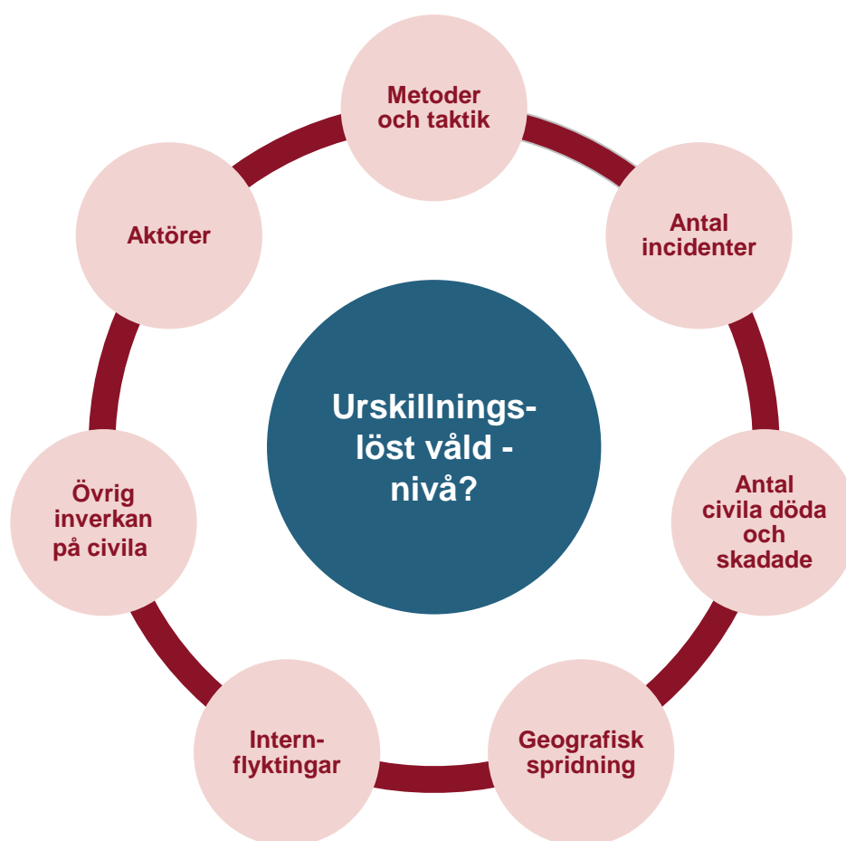
Figur 2 - relevanta faktorer vid bedömning av nivån på urskillningslöst våld