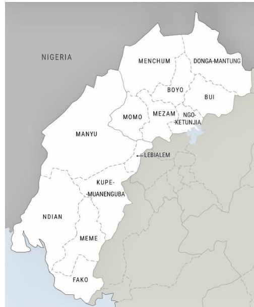
Karta E: Departementsindelning i regionerna