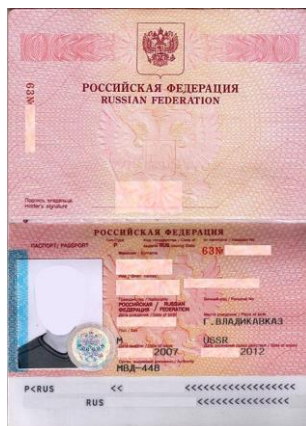
Ryskt utrikespass (ej biometriskt)

Det är möjligt att få ryskt utrikespass utfärdat vid ryska ambassader i utlandet. Enligt lag ska personen som ansöker om pass personligen hämta ut det. 137 Män mellan 18 och 27 måste även ta med ett intyg från det lokala militära värvningskontoret eller ett bevis på genomförd militärtjänst. 138 Under militärtjänst eller liknande kan man förvägras utresa, vilket innebär att man saknar rätt till utrikespass. Innan inkallelsen har man dock rätt till ett sådant. 139