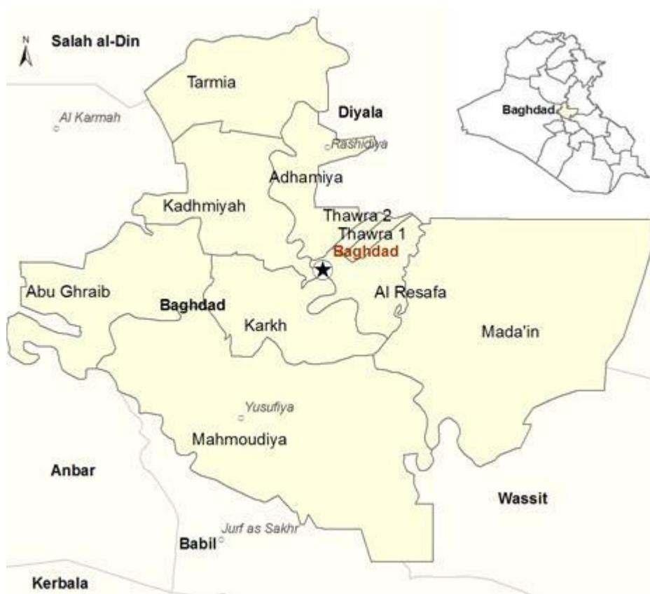
Karta över Bagdadprovinsen: Joint Analysis and Policy Unit (JAPU) 23

oktober med något färre. I östra Bagdad var det inte bara IS, som låg bakom våldet. En vecka i oktober hittades fyra dumpade kroppar, som kan ha avrättats av kriminella eller PMU- relaterade grupper. Två skjutningar där kan ha utförts av vem som helst. En kidnappning låg ett gäng kriminella bakom. Fem improviserade sprängningar riktade mot affärsintressen visade IS avtryck. IS stod för de flesta attackerna i provinsen. I hela Irak fortsatte attackerna att minska i november, till årslägstänoteringen 530, ett tecken på att IS varit på defensiven större delen av år 2015. I Bagdad låg de kvar på september månads nivå och drygt 300 människor dödades (i likhet med september), nästan alla civila. Bagdad är den enda provins där attackerna ökat under året. Bagdad har förutom Anbar varit huvudfokus för IS sedan slutet av 2014. Till skillnad från Anbar har det inte förekommit regelrätta strider i Bagdad. IS har dock förmåga genomföra terroristattacker i staden och har sedan sex månader ökat användningen av bilbomber. De flesta oskadliggörs, men när väl en bilbombsattack mot "mjuka mål" lyckas blir förlusterna stora. IS har baser i utkanterna av provinsen och för också in män och sprängmedel från Babil, Salah al-Din och Diyala. I Anbar är de nog för upptagna av striderna mot ISF och PMU för att därifrån lyckas infiltrera Bagdad. En skyddsmur ska 2016 byggas runt staden.