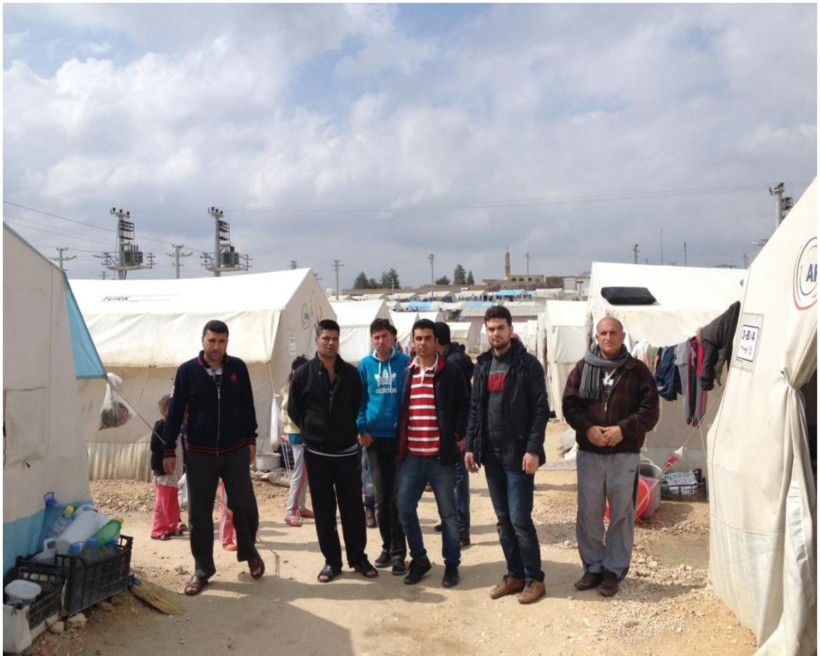
Lägret Shariya utanför Dohuk i den kurdiska regionen i Irak