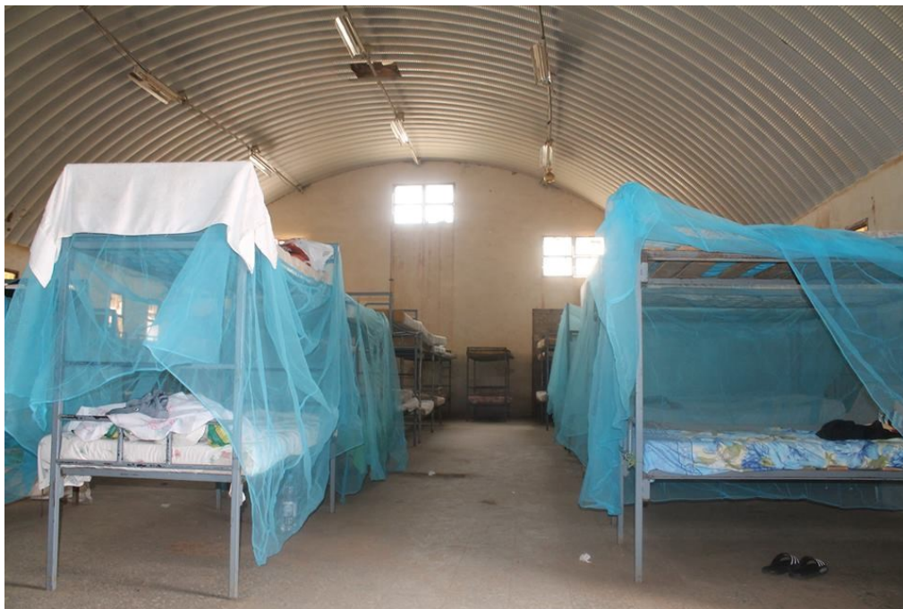
Sovesal i Sawa. Bildet er tatt sommeren 2014.

trening. (U.S. Embassy Eritrea 2006a). Det finnes også flere mindre butikker som selger dagligvarer og andre ting folk har bruk for. Foreldre kan dessuten besøke barna sine i Sawa, og det finnes overnattingsmuligheter for dem på området (lokal eritreisk kilde, samtale i Asmara 29. januar 2013; internasjonal representant (2), samtale i Asmara 30. januar 2013; representant for NUEYS, samtale i Asmara 6. februar 2013; diplomatisk kilde (5), samtale i Asmara 14. januar 2015). Gutter og jenter bor på separate sovesaler, men omgås fritt resten av døgnet.