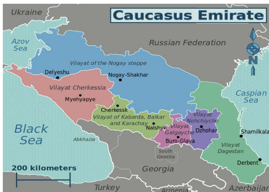
(Illustrasjon av Arnold Platon, gjengitt i Wikipedia 2013)

Organisatorisk og militært er emiratet inndelt i ulike fronter/provinser, eller vilayats (arabisk: provins), som i all hovedsak korresponderer med de politisk-administrative grensene i regionen: Vilayat Dagestan, Vilayat Nokhchicho (Tsjetsjenia), Vilayat Ghalghaycho (Ingusjetia og Nord-Ossetia), Vilayat Kabarda, Balkaria og Karachay og Vilayat Nogai 26 (Hahn 2010; Jane's World Insurgency and Terrorism 2013).