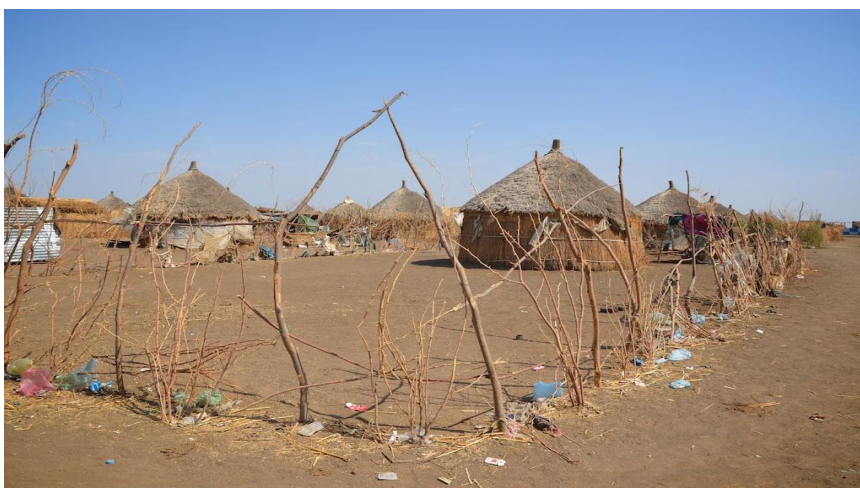
Bostäder i flyktinglägret Wad Sharifey.

Det finns temporärt boende för nyanlända asylsökande i Shagarab I. När man fått beslut i sitt ärende flyttas man ut i flyktinglägren och där bor man i traditionella hus, tukols (Se bilden nedan.). 92