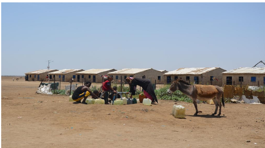
Boende för nyanlända under asylprocessen i Shagarab I.

Det är endast i flyktinglägret Shagarab I som sudanesiska myndigheter registrerar nyanlända asylsökande och genomför flyktingstatusbedömning. UNHCR är inte del av själva asylprocessen. 74 Shagarab grundades 1984. Det finns numera tre läger på platsen (Shagarab I, II och III), en mottagningsanläggning och ett center för flyktingstatusbedömning. Sedan 2008 har registrering av nyanlända asylsökande och flyktingstatusbedömning gjorts i Shagarab I. Dessförinnan gjordes det i flyktinglägret Wad Sharifey som ligger nära Kassala stad. Shagarab ligger cirka 200 km från Kassala stad. 75