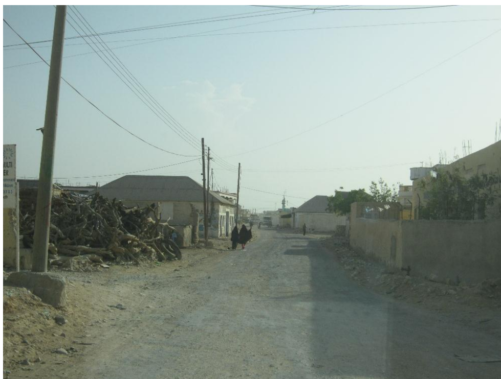
Gatuvy från Boosaaso, Somalia, juni 2012.

Rapport från utredningsresa till Nairobi, Kenya och Mogadishu, Hargeisa och Boosaaso i Somalia i juni 2012.